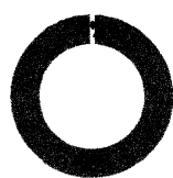
Cumplimiento Gestión EPP

3. Seguimiento a las medidas de Bioseguridad